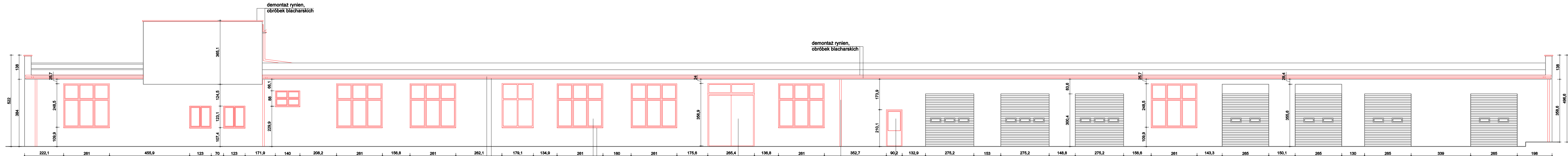
elewacja północna ↑ B